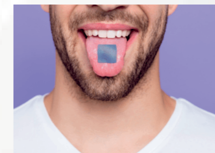
Indicado para uso Humano