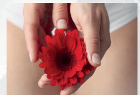
Indicado para uso Vaginal